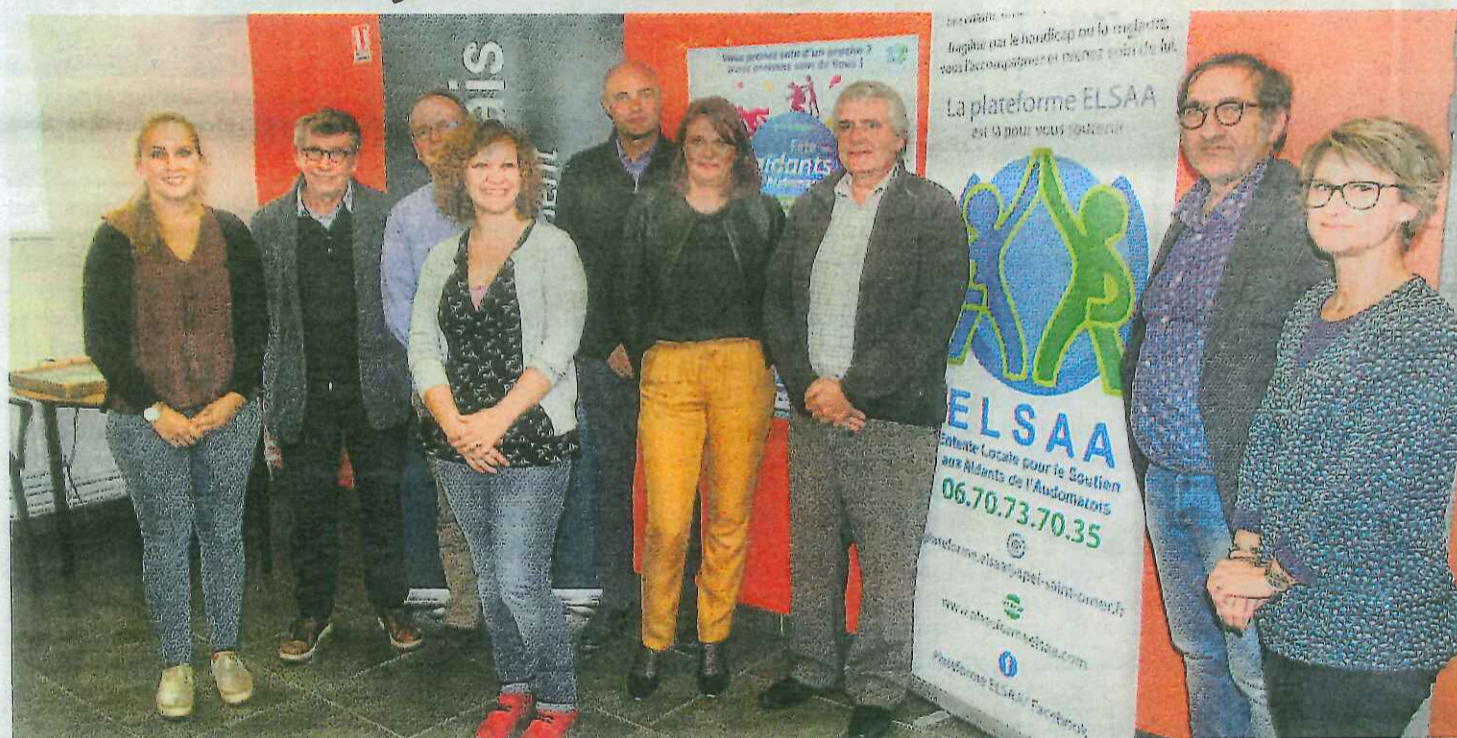
Ils unissent leurs forces pour soutenir les aidants.